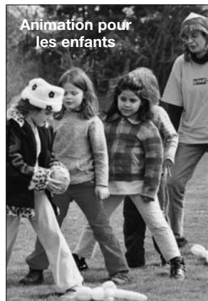
Animation pour les enfants