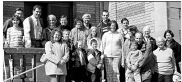
Les participants devant l'église de Munster

Et pour terminer cette belle journée, les organisatrices (bravo et merci à