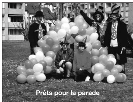
Prêts pour la parade